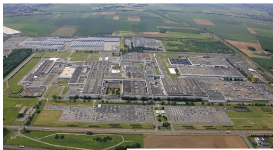
150 ha = 215 terrains de foot !

Cette opération est un parfait exemple du savoir-faire et de l'agilité de l'EPF, de sa capacité à conjuguer l'action foncière à tous les temps : le temps court de l'économie, le temps long de l'aménagement. Créé il y a 30 ans pour effacer les stigmates de la désindustrialisation, il est aujourd'hui l'un des acteurs du renouveau économique régional.