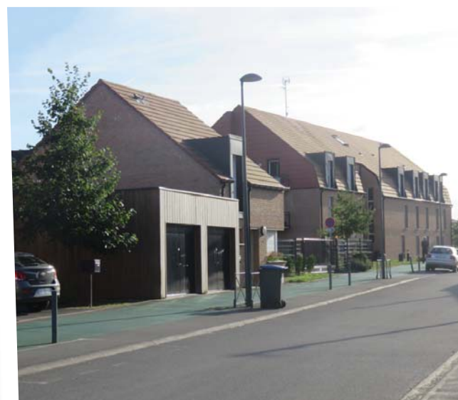
Septembre 2016 : vue d'ensemble

Favoriser l'offre de logement social en milieu rural