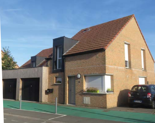
Septembre 2016 : l'une des maisons construites

Une première tranche de 19 logements locatifs sociaux (5 maisons individuelles et un collectif de 14 appartements) a vu le jour en 2011. La construction de 13 maisons individuelles démarreront en octobre 2016. Au total, ce seront donc 32 logements locatifs qui accueilleront une population désireuse de vivre dans ce territoire rural proche de la métropole, à "Cappelle en Pévèle, le village où il fait bon vivre".